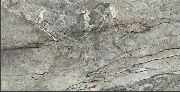
GRAY ZS09 80 X 160 cm rectificado 60 X 120 cm rectificado