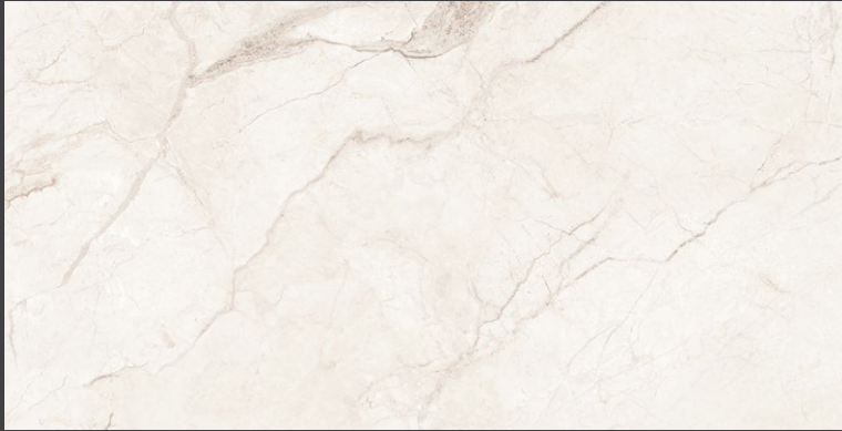
CREAM ZAO6 60 X 120 cm rectificado