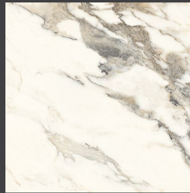
BLANCO ZAV4 BRILLANTE 60 X 60 cm rectificado