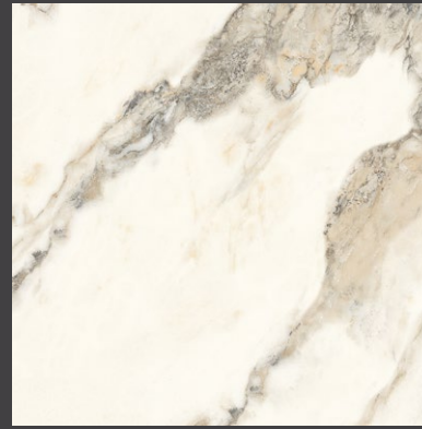
BLANCO ZAV3 SATINADO 60 X 60 cm rectificado